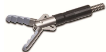
Atrau Short Grabber