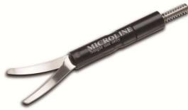
Endocut 19,3 mm Scherenfläche