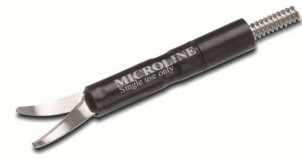
Mini Endocut 13,5 mm Scherenfläche