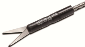
Delicate Metzenbaum 14,7 mm Scherenfläche