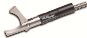
Hook 12,7 mm Scherenfläche