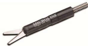
Micro 11,2 mm Scherenfläche