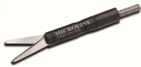
Metzenbaum 14 mm Scherenfläche